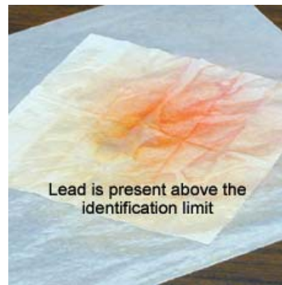
Rojo/rosa = plomo arriba del límite de identificación visual (18µg) Lea los resultados