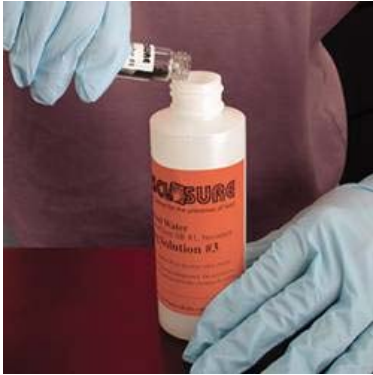
Prepare la solución