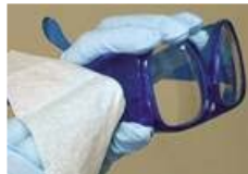
Tome la muestra